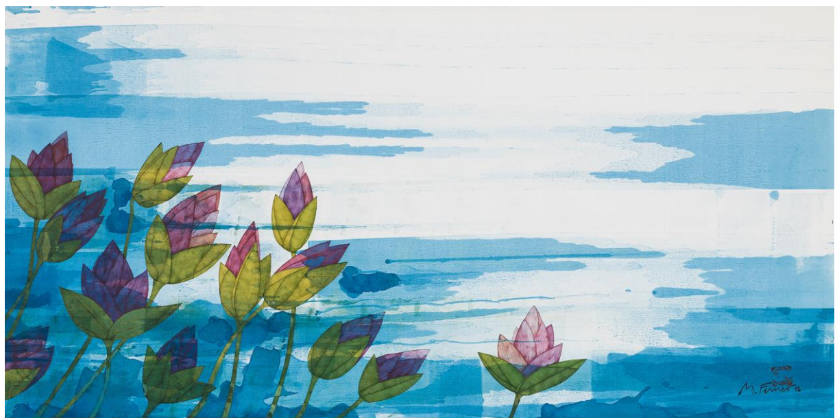
Lotusblumen Michael Ferner 2013 Art.Nr. 639 Mischtechnik auf Arches 375g kaschiert auf Alu Dibond Format: 60x120cm