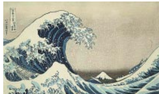
Rechts: Hokusai Die große Welle vor Kanagawa 1830

nimmt der Zeichner Menschliches, Allzumenschliches oder Absurdes auf's Korn. Für ihn ist Humor ein Chauffeur, der den auf der Rückbank sitzenden Philosophen fährt. Humor setzt ein bewusstes, achtsames Wahrnehmen voraus, drängt sich nicht auf, sondern lässt zu. So fungiert er als Türöffner für eine Sichtweise der Wirklichkeit, die der Betrachter sich selbst erschließen kann.