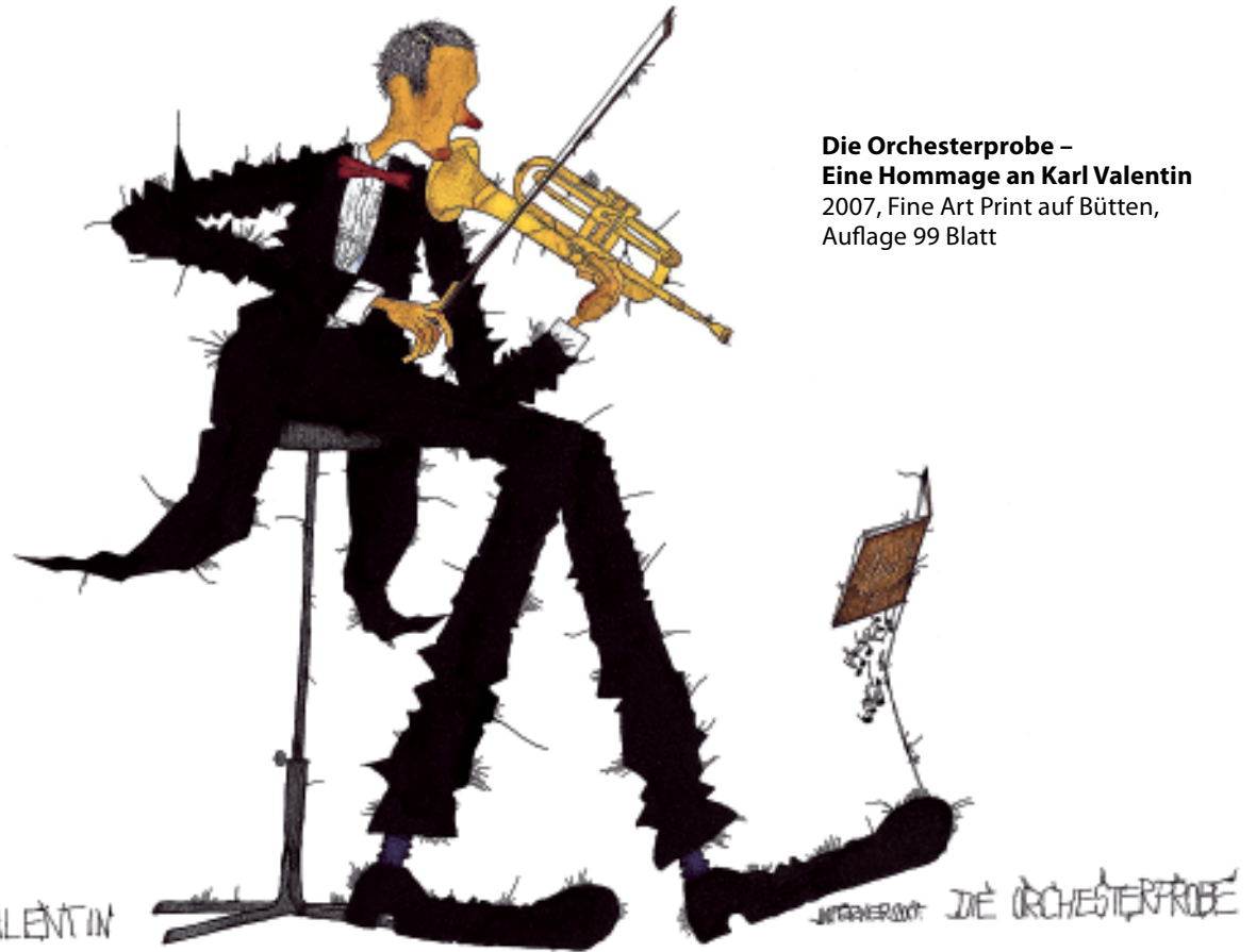
Die Orchesterprobe – Eine Hommage an Karl Valentin 2007, Fine Art Print auf Bütten, Auflage 99 Blatt