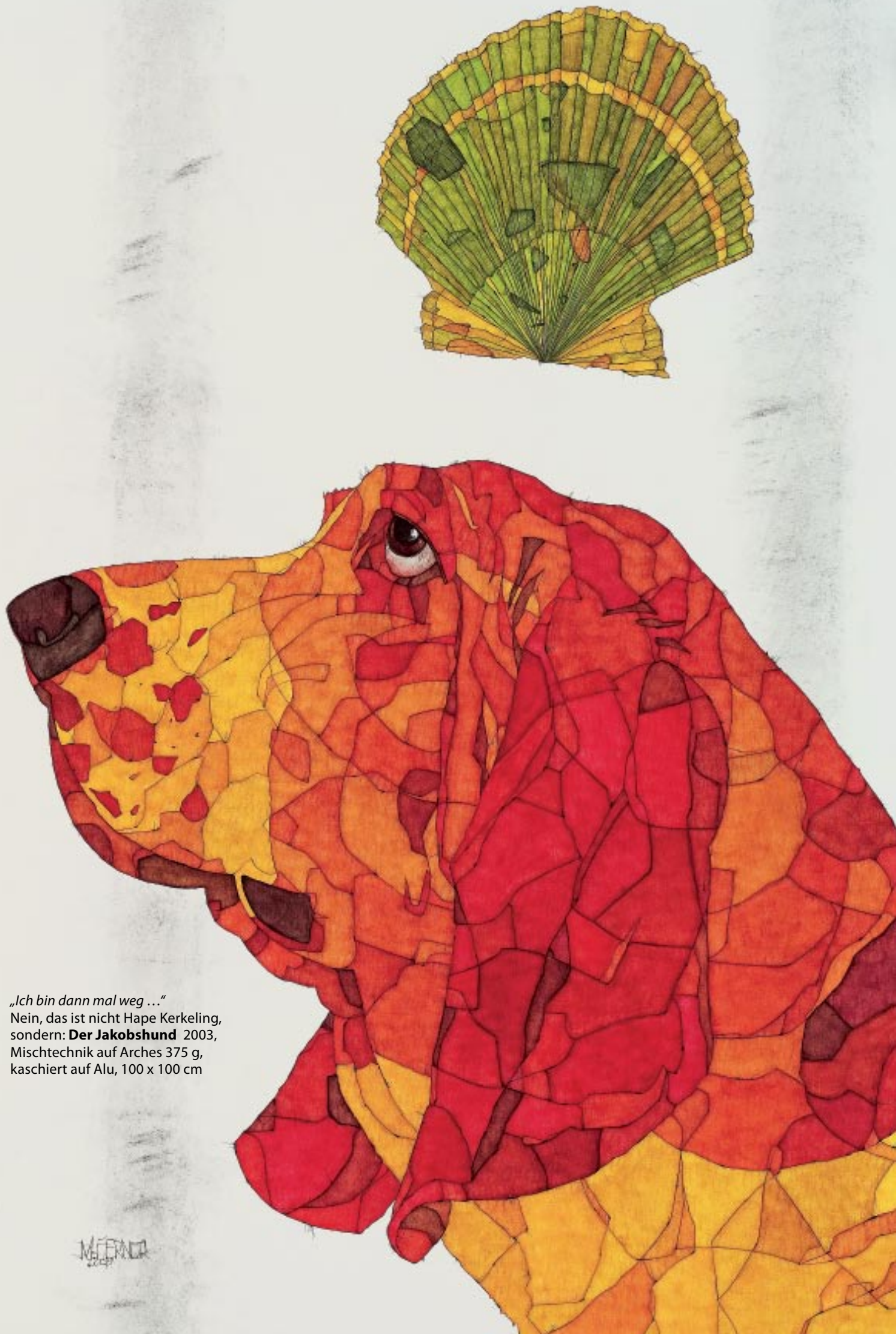
„Ich bin dann mal weg ...“ Nein, das ist nicht Hape Kerkeling, sondern: Der Jakobshund 2003, Mischtechnik auf Arches 375 g, kaschiert auf Alu, 100 x 100 cm