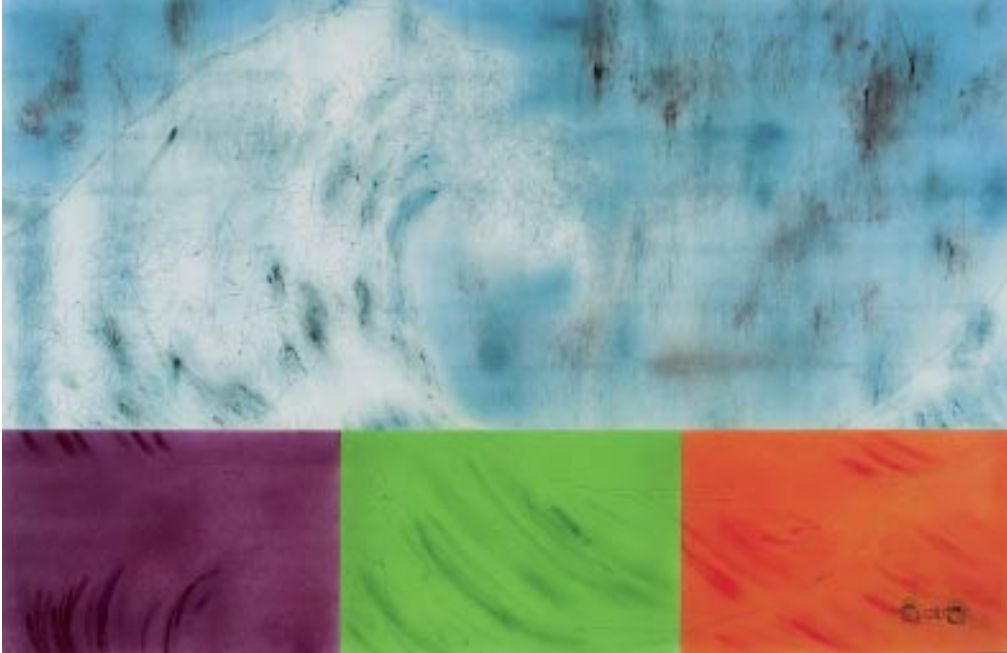
Links: Eine kleine Paragraphenverkettung 2007, limitierter Kunstdruck, 30 x 50 cm